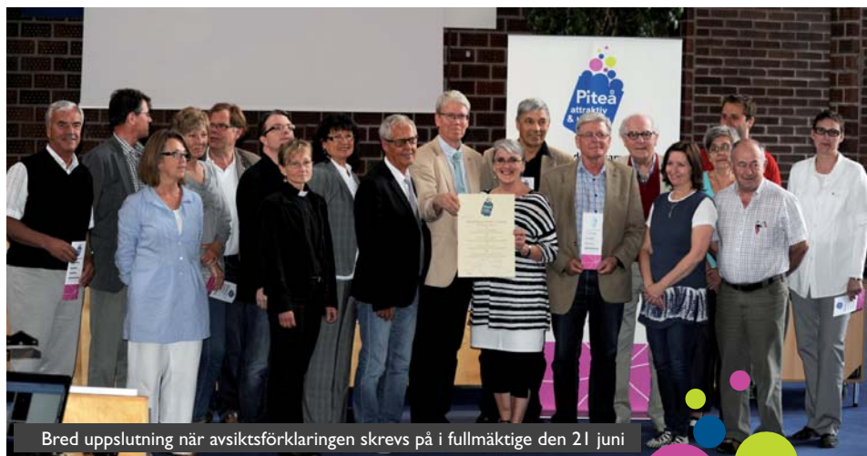
Bred uppslutning när avsiktsförklaringen skrevs på i fullmäktige den 21 juni