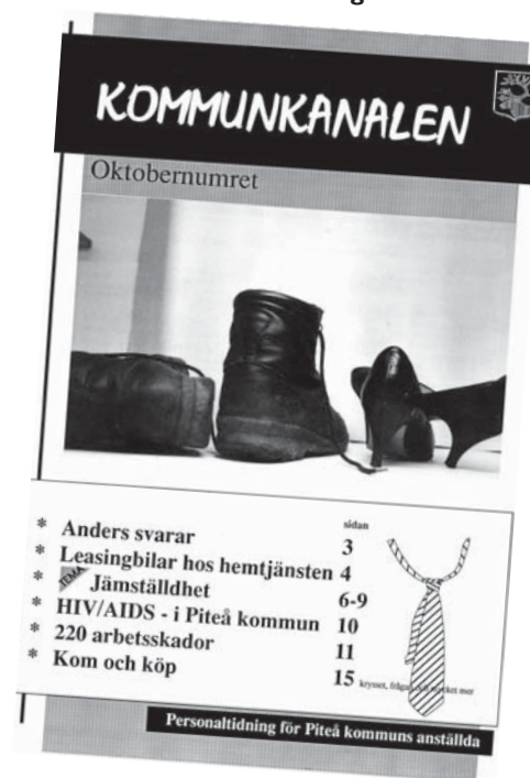
Personaltidning från 1990