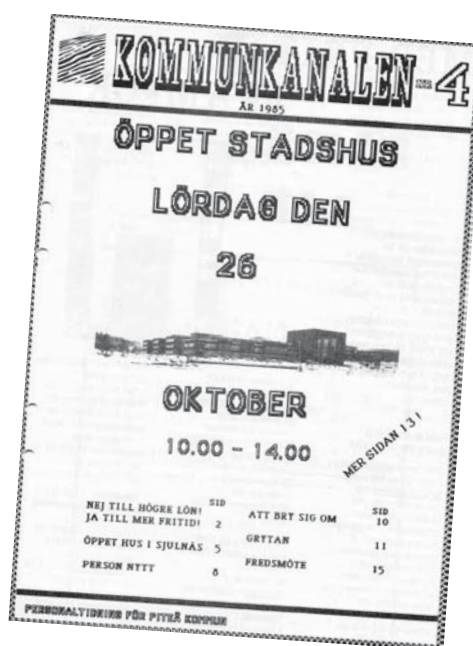
Personaltidning från 1985