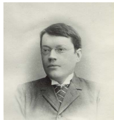
K. A. Lundström Ur Piteå Museums fotosamling