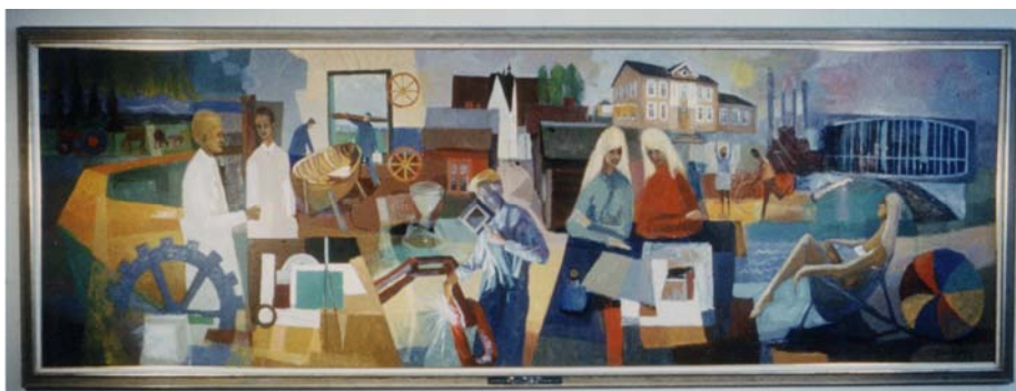
Konstnär: Folke Sjöberg 1966

26. Med tillit stor att detta hänt jag överlämnar glatt till stadens preses som present min tavla här på Statt.