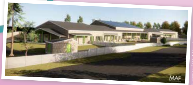
Illustration: MAF Arkitektkontor