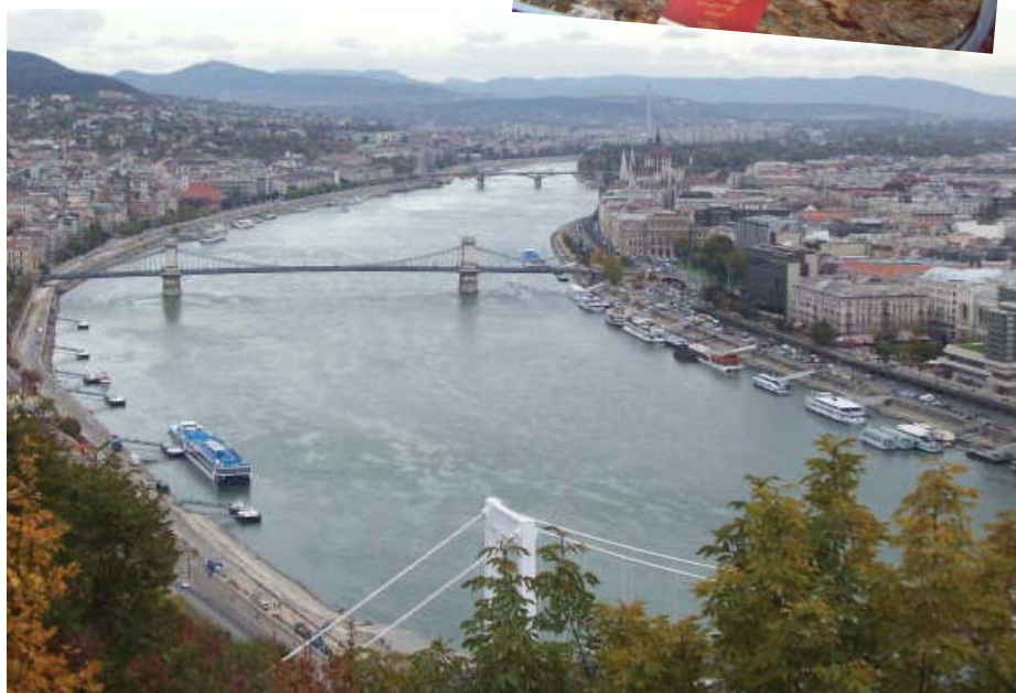
Budapest är en vacker stad.