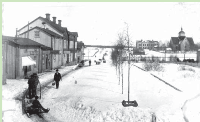
Uddmansgatan mot norr från korsningen med Storgatan omkring 1900.