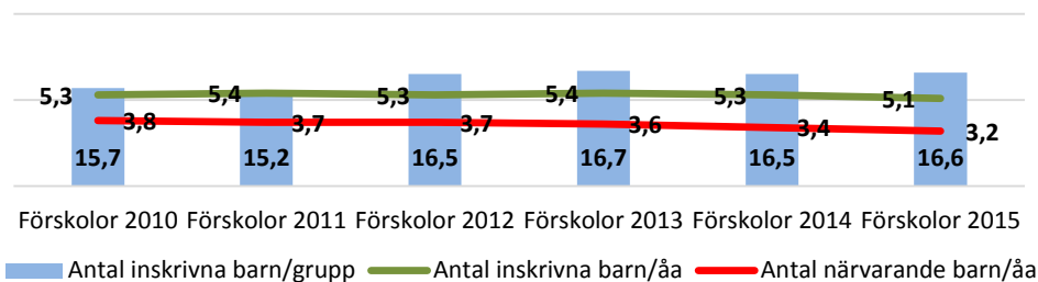
Genomsnittligt antal barn per år enligt närvaromätning febr och okt

I stort sett alla förskoleenheter redovisar överskott som täcker kostnaden för volymökning utöver budget. Förskolan har haft en genomsnittlig volymökning på 16 platser, vilket motsvarar en ökad kostnad på ca 1,6 mkr. Enligt närvaromätningen har det genomsnittliga antalet barn/grupp inte ändrats nämnvärt de fyra senaste åren. Antalet inskrivna barn och även närvarande barn per årsarbetare har minskat jämfört med 2014.