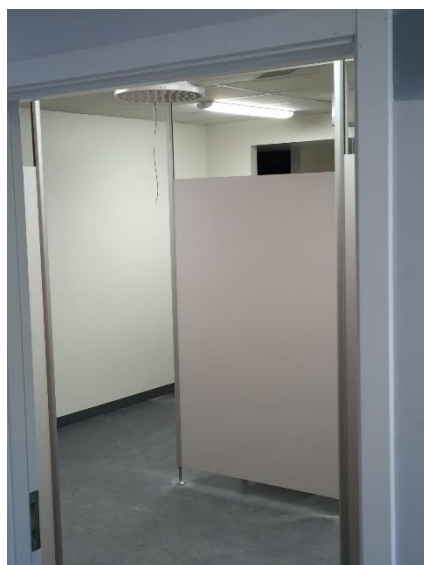
Bild 1 Insyn från korridor Strömnässkola

För att skapa avskildhet i omklädningsrummet så kan skärmar sättas upp i omklädningsrummet så att direkt insyn förhindras. De ska inte gå att öppna dörren och ha insyn i hela omklädningsrummet.