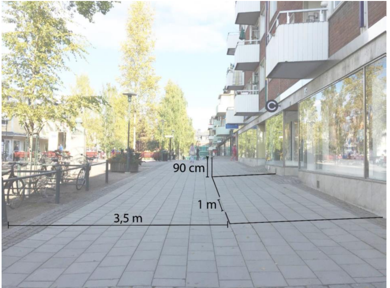
Illustration som visar uteservering i direkt anslutning till fasad. Räddningstjänsten kräver här fri passage på 3,5 meter.