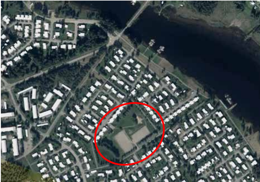
Figur 1. Det markerade området markerar Djupvikskullarna

Den första kommentarer berör området kring "Djupvikskullarna". Personen anser att markytan i dagsläget har en begränsad användning och borde vara utmärkt för byggande av bostäder. Detta förslag är gillat i CityPlanner.