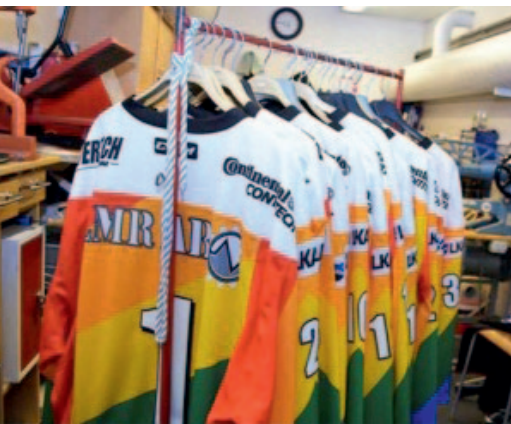
I juni 2014 kom beskedet om att Kiruna IF skulle spela i regnbågsfärgade matchtröjor.