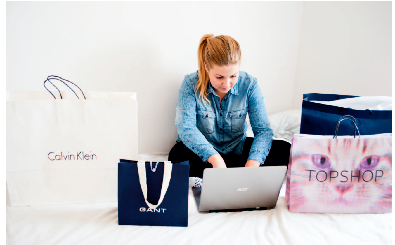
Över 80 procent av ungdomarna internetshoppar idag, en siffra som har ökat drastiskt under de senaste åren.

på sociala medier så att man når folk och kan locka in dem i butiken. Så de får chansen att se vad som är nytt och kanske dras hit.