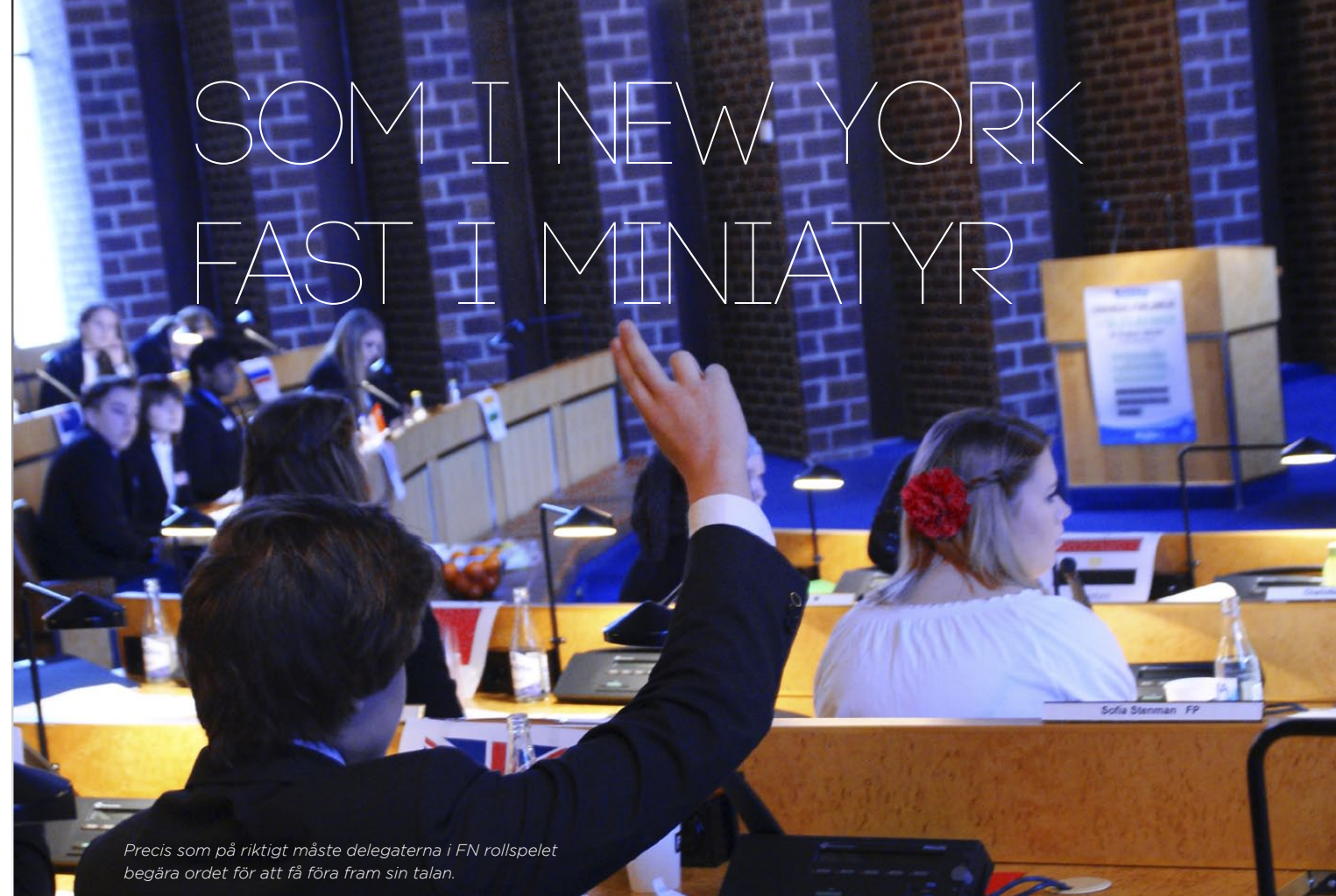
Precis som på riktigt måste delegaterna i FN rollspelet begära ordet för att få föra fram sin talan.

Sedan början på 90-talet har Strömbäckaskolan varje år anordnat ett så kallat FN-rollspel. Under en torsdag och fredag i våras samlades de väl pålästa "delegaterna" från 14 medlemsländer och försökte hitta lösningar på internationella problem.