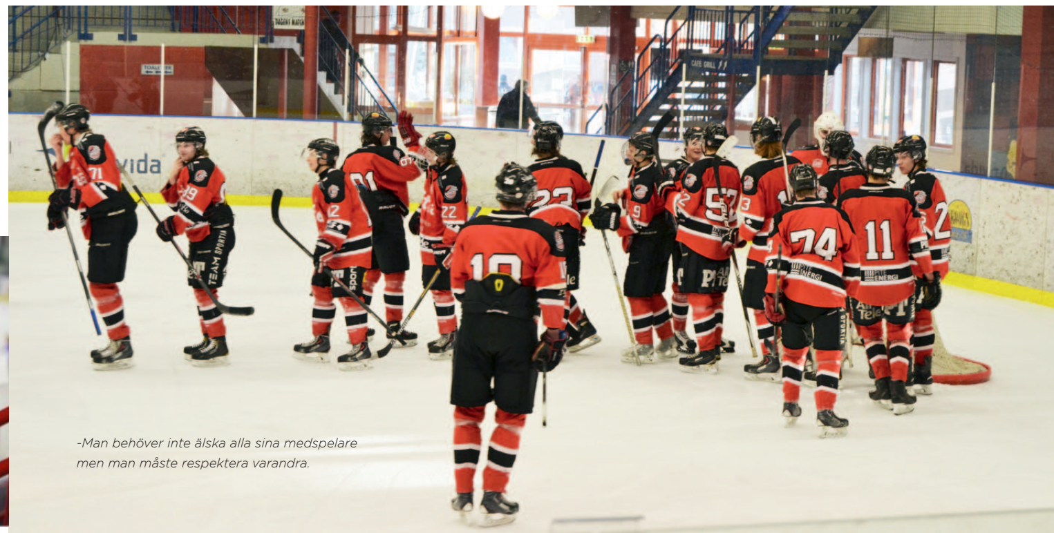
-Man behöver inte älska alla sina medspelare men man måste respektera varandra.

Framgångarna för Piteå Hockey har under denna säsong varit stora. Men att varva träning och matcher med det vanliga livet så som skola, jobb och vänner kan vara svårt. Vi på Åssit har träffat fyra av killarna samt tränarna bakom för att ta reda på hur de prioriterar och hur man gör för att vinna en serieseger.