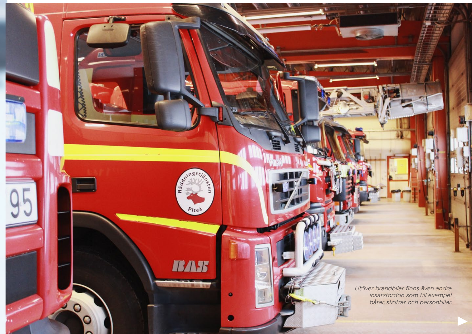
Utöver brandbilar finns även andra insatsfordon som till exempel båtar, skotrar och personbilar.

Dessutom sker ett konditionstest både vid intagningen till utbildningen och varje år på stationen. Det innebär att man ska gå fullt iklädd larmutrustning på rullband med 5,6 i hastighet och åtta graders lutning under fem minuter. Larmutrustningen väger ungefär 24 kilo. Vi tänker att det är väldigt tungt att bära på när man dessutom har mycket kläder på sig när vi går ut från brandstation, och kommer fram till att om vi någon gång bestämmer oss för detta yrke är det bäst att vi börjar träna i tid.