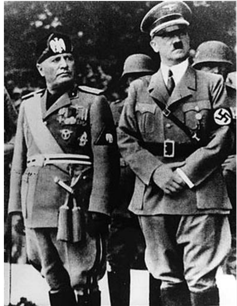
Mussolini och Hitler