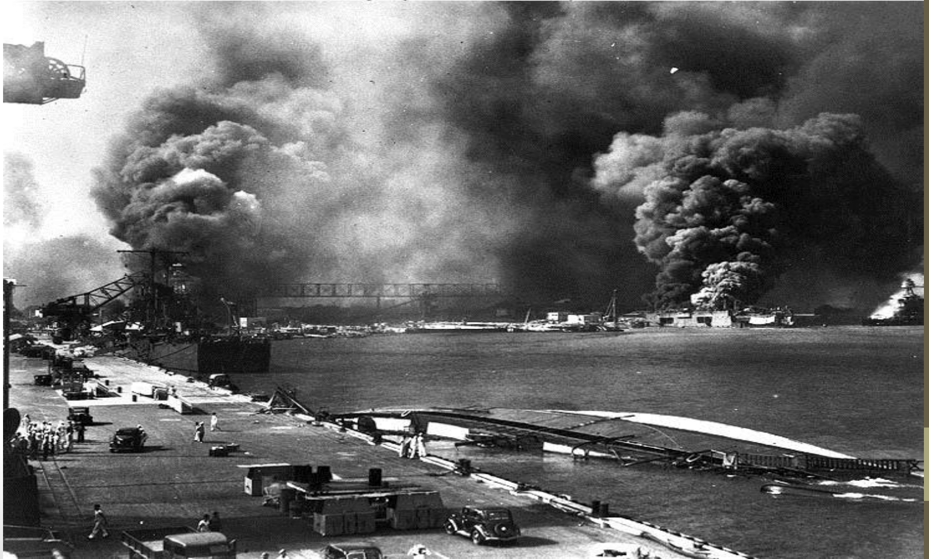
Photo # 80-G-474789 Burning ships in Pearl Harbor drydocks, 7 December 1941