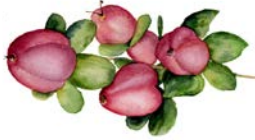
NÅGOT SOM LUKTAR GOTT