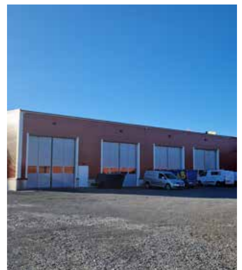
Vi har en ny toppmodern maskinhall

Maskiner och tekniks utrustning inom naturbruk nivå 1, 2 och 3