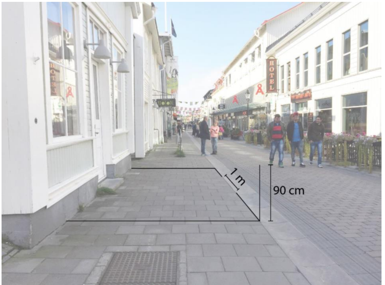
Illustration som visar att uteserveringar längs gågatan ska placeras i direkt anslutning till fasaden och får sträcka sig ut till kant för gatstensbeläggning